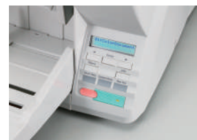
Panel de Control Intuitivo

Mediante el panel de control intuitivo del escáner DR-X10C, usted puede seleccionar botones programables y previamente registrados para "Escanear hacia Trabajos", verificar mensajes desplegados y seleccionar las fijaciones del escáner. La